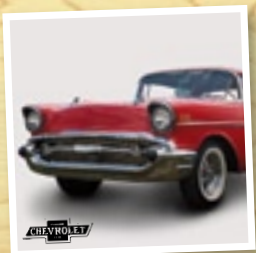
Teil 1: Louis Chevrolet – der verkaante Schweizer Autopionier

Im Beobachter läuft aktuell die neue Serie «Vergessen und verkaant – die andern Schweizer Karrieren». In 12 Ausgaben finden Sie die spannenden Lebensgeschichten von Schweizern, die Grosses geleistet haben, doch lange im Verborgenen blieben. Verpassen Sie keine Folge: Jetzt 12x den Beobachter lesen, 56% sparen und garantiert die komplette Serie erhalten!