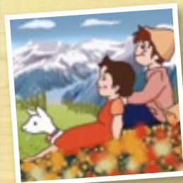
Teil 3: Johanna Spyri – Heidis Autorin unter Plagatsverdacht